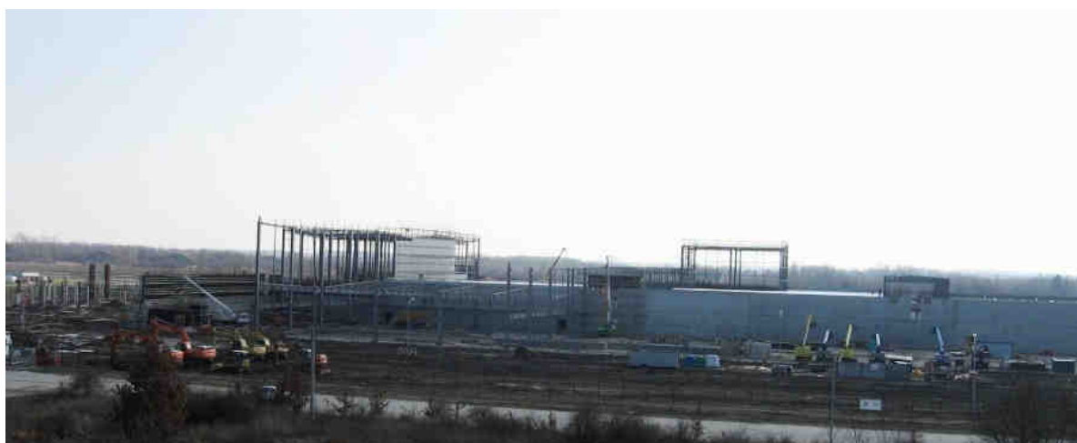
Cadbury Wedel – budowany zakład produkcji czekolady