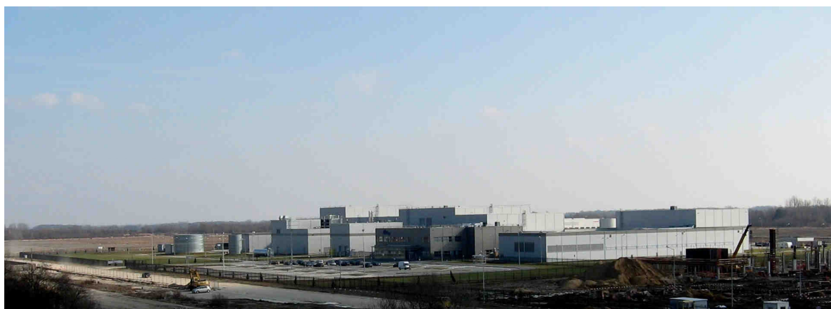
Cadbury Polska – zakład produkcji gumy do żucia

W lutym 2008 zostały ogłoszone kolejne inwestycje Cadbury w Polsce, które kosztować będą 250 mln euro i obejmują: rozbudowę zakładu w Bielanych Wrocławskich oraz budowę nowej fabryki czekolady w Skarbimierzu.