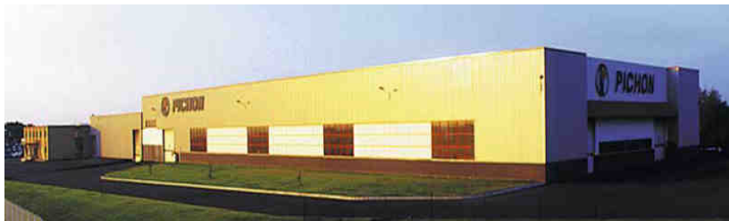
Zakład rodziny PICHON we Francji

Firma Pichon kupiła za ponad milion złotych byłe Opolskie Zakłady Przemysłu Lniarskiego - Linopłyt. Zamierza tam produkować wozy asenizacyjne dla rolnictwa.